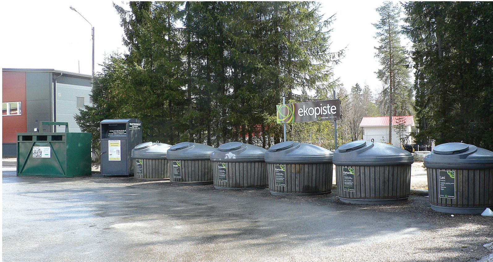
S-marketin pysäköintialueella oleva lajittelupiste on siisteimpiä ja edustavimpia koko Kainuussa.

Suomussalmella jätelain uudistumiseen on varauduttu jo pidemmällä ajalla. Parhaimmillaan tämä näkyy kauppaliikkeiden pihoihin ilmestyneinä syvässäilöinä ohjeistuskyltteineen. Lajitteluasema ottaa vastaan lähes kaiken kotitalouksissa syntyvän jätteen. Kotitalouksissa tämä tarkoittaa sitä, että jäte tulisi lajitella ja tiedostaa eri jätelajit. Pölykankaalla toimiva lajitteluasema ottaa vastaan mm. kotitalouksien kevätsiivouksien yhteydessä syntyvät haravointi- ja pensaiden leikkausjätteet vastaan maksutta. Ekokymppin sivuilta ( www.ekokymppi.fi ) löytyvät ohjeistukset lajitte- luun, eri jätteiden käsitte-